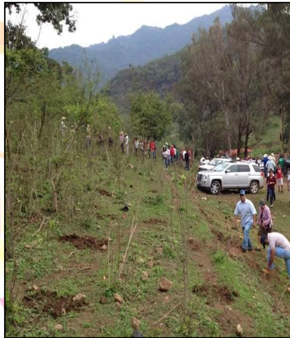
Campañas de reforestación

PALACIO MUNICIPAL S/N, COL.CENTRO, ZACAZONAPAN, ESTADO DE MEXICO.