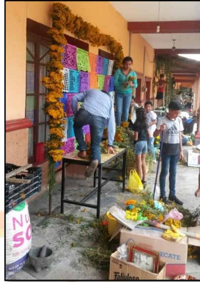
Concurso de ofrendas 2019 del Municipio de Zacazonapan