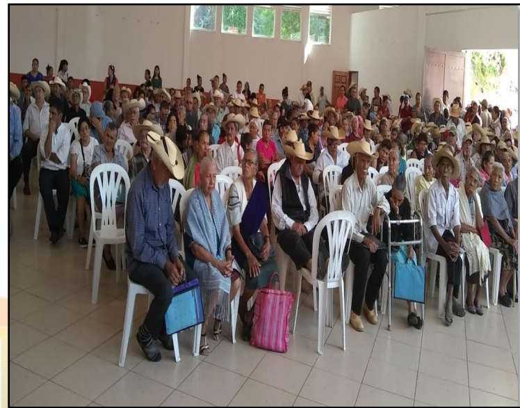
Pensión para adultos mayores