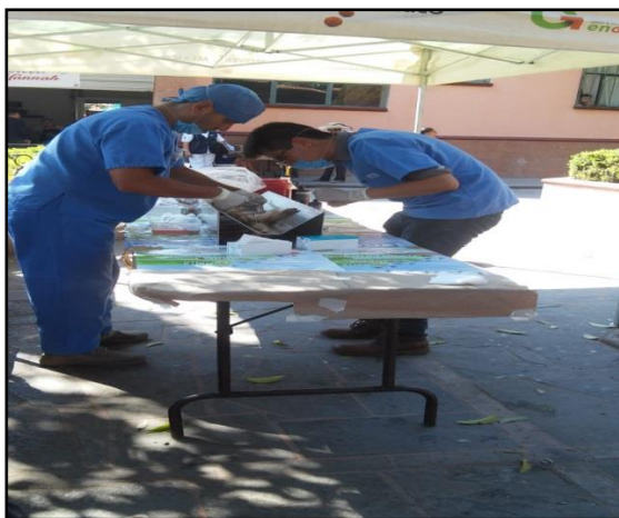
Esterilización de mascotas