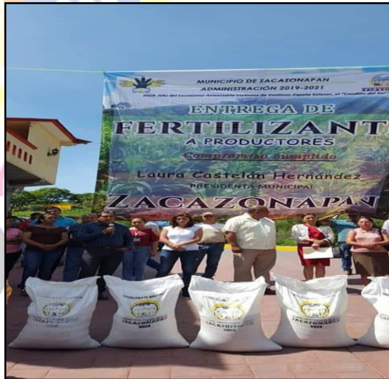
Apoyo con fertilizantes para los agricultores del Municipio

PALACIO MUNICIPAL S/N, COL.CENTRO, ZACAZONAPAN, ESTADO DE MEXICO.