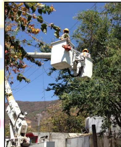
Energía eléctrica y su mantenimiento