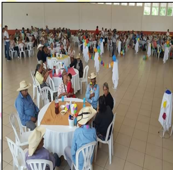
Festejos a nuestros adultos mayores