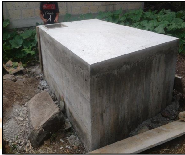
Cisternas para la administración del recurso agua

SIGAMOS CONSTRUYENDO UN MEJOR ZACAZONAPAN