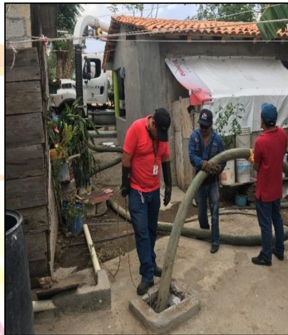
Mantenimiento a drenajes municipales / Camión Váctor