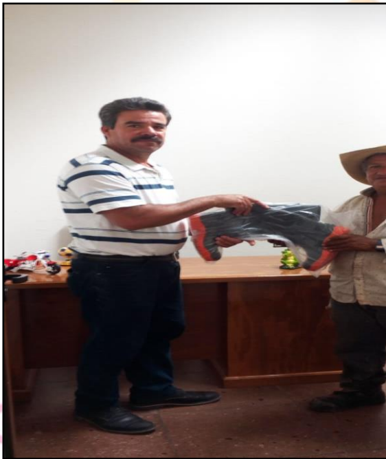
Entrega de utilitarios