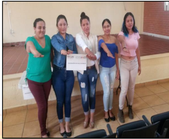
Capacitación permanente en temas diversos que nutren la cultura