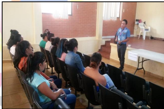
Usuarios del auditorio de la Casa de Cultura

PALACIO MUNICIPAL S/N, COL.CENTRO, ZACAZONAPAN, ESTADO DE MEXICO.