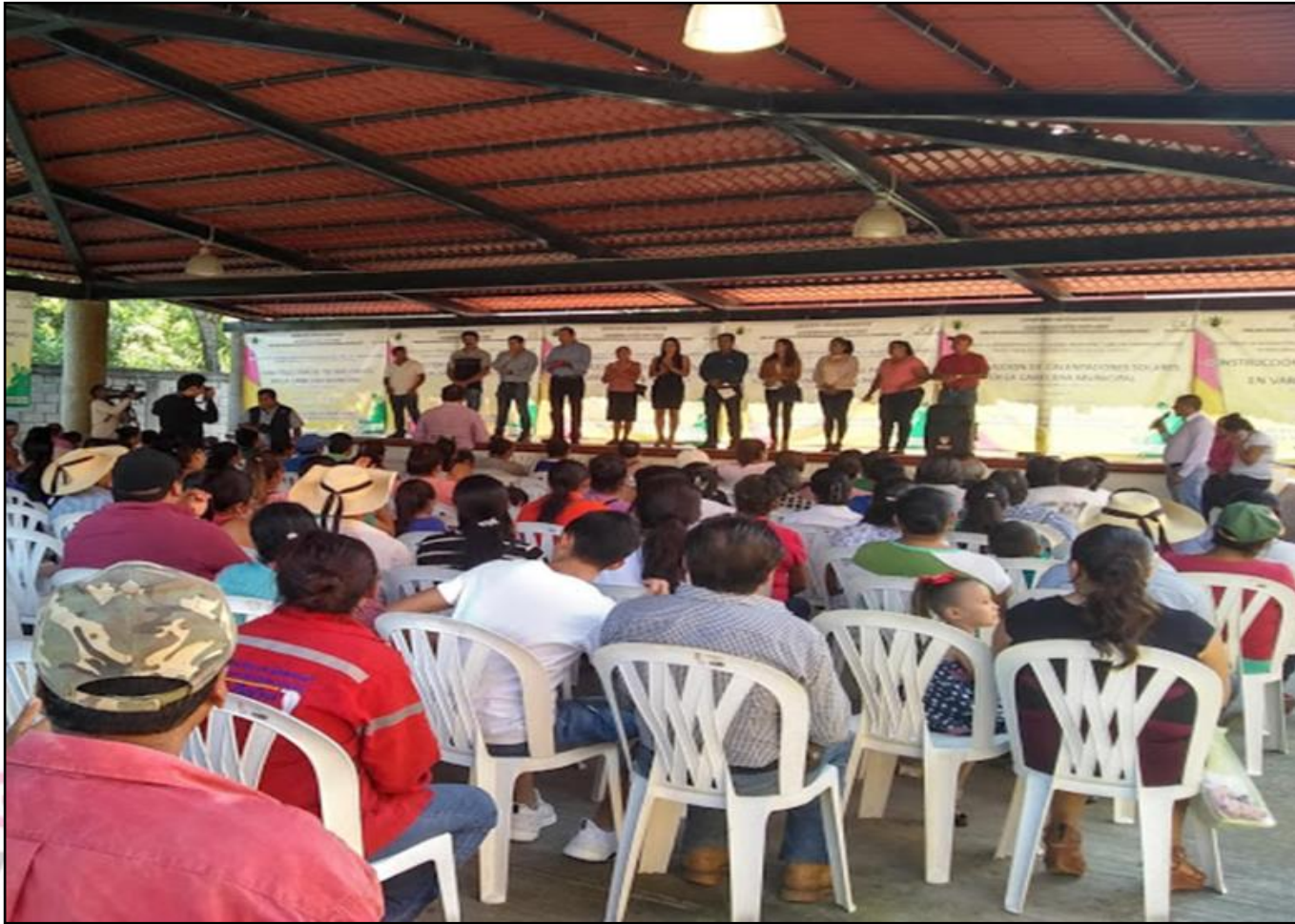
Entrega de sacos de semilla de maíz

Apoyo a los agricultores del Municipio, con semillas mejoradas de maíz