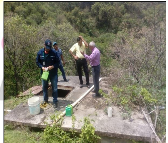
Acciones por el agua en el Municipio de Zacazonapan

PALACIO MUNICIPAL S/N, COL.CENTRO, ZACAZONAPAN, ESTADO DE MEXICO.