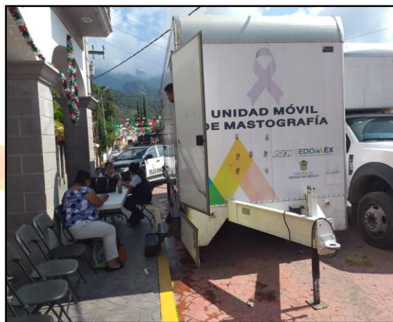
Campaña de Mastografía