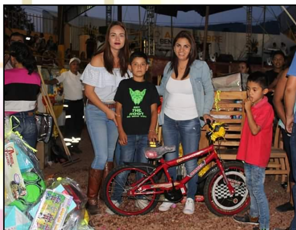
Festejo de "Día del Niño"