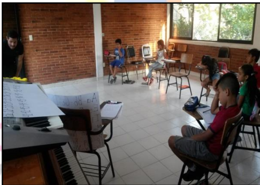
Usuarios de la biblioteca de la Casa de Cultura