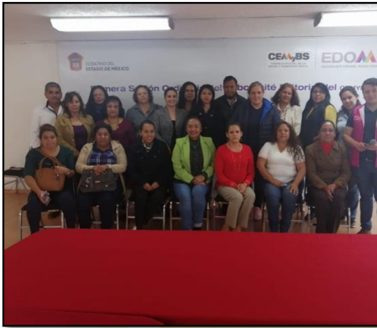
Capacitación impartida por el Instituto de la Mujer "Prevención y cuidados en embarazos de adolescentes"

"2019. Año del Centésimo Aniversario Luctuoso de Emiliano Zapata Salazar, El Caudillo del Sur"