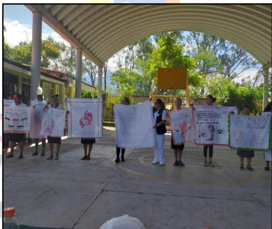
Campaña de promoción de la salud