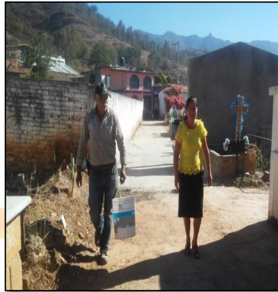
Limpieza general del Panteón Municipal