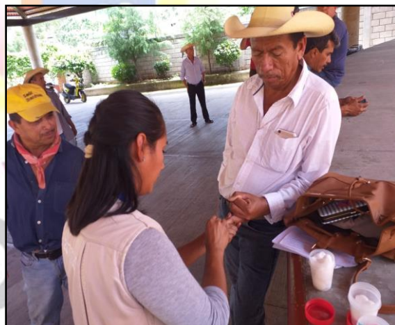
Campaña de vacunación