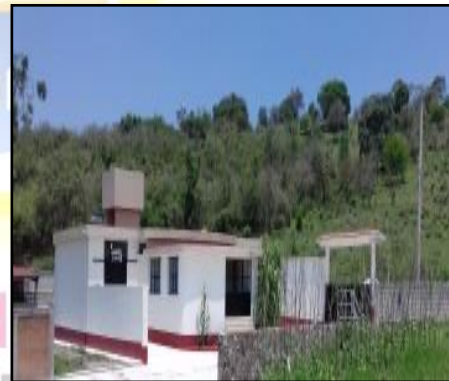
Instalaciones del Nuevo Rastro Municipal y Planta Tratadora de Agua