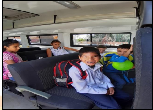
Transporte para personas de Capacidades Diferentes