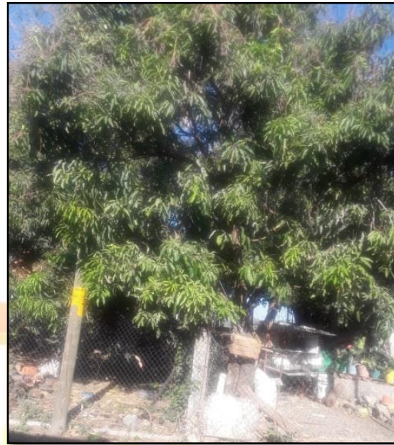
Fumigación para el control de plagas de árboles frutales