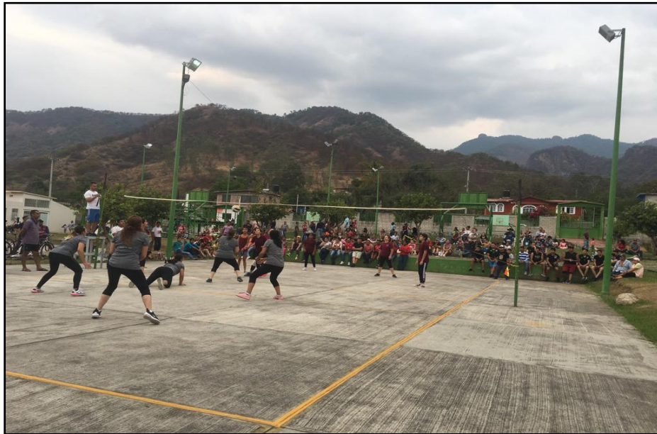
Liga del Voleibol Femenil

"2019. Año del Centésimo Aniversario Luctuoso de Emiliano Zapata Salazar, El Caudillo del Sur"