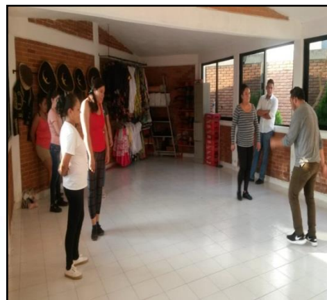
Fomento de diversas actividades culturales