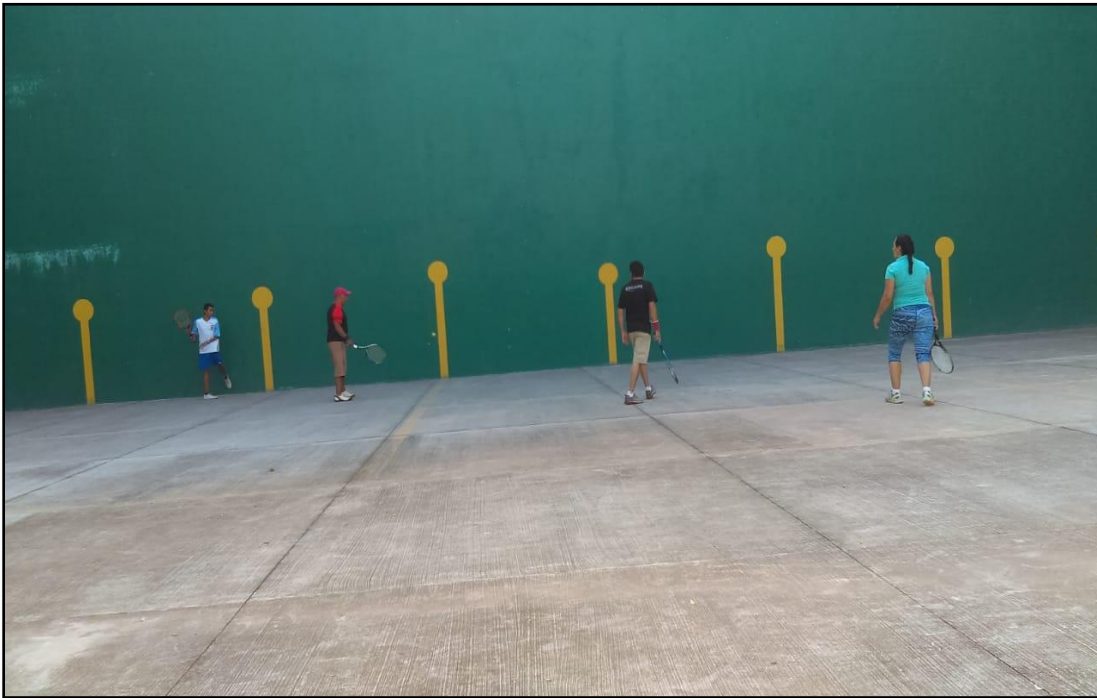
Primer Torneo de Frontón

"2019. Año del Centésimo Aniversario Luctuoso de Emiliano Zapata Salazar, El Caudillo del Sur"