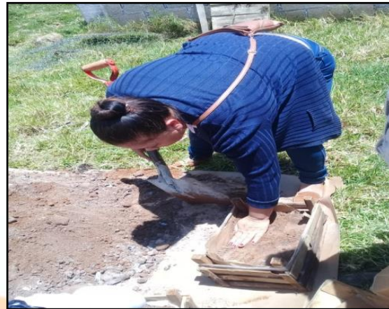
Programa Horta-DIF de huertos familiares