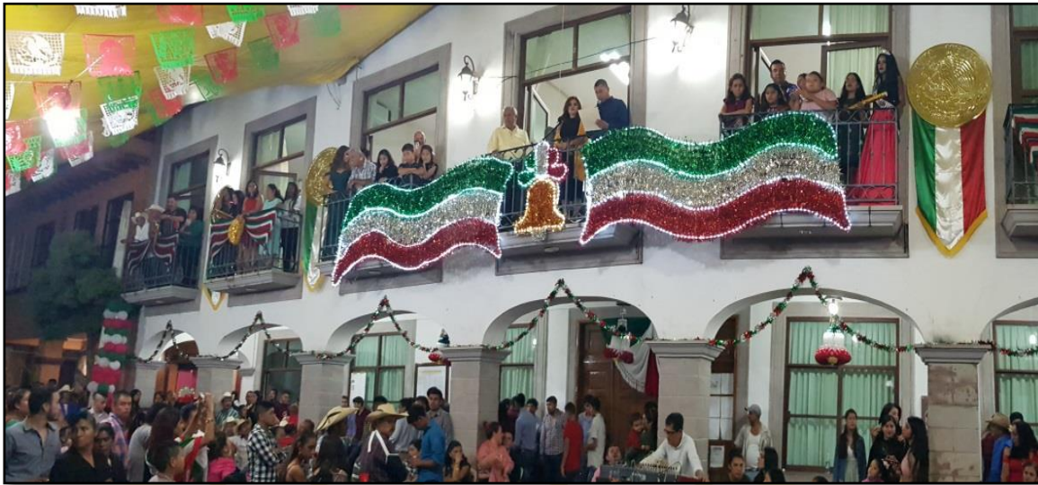
Eventos socio-culturales en Zacazonapan

"2019. Año del Centésimo Aniversario Luctuoso de Emiliano Zapata Salazar, El Caudillo del Sur"