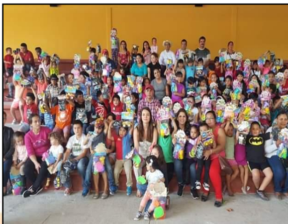
Festejo del "Día de Reyes"