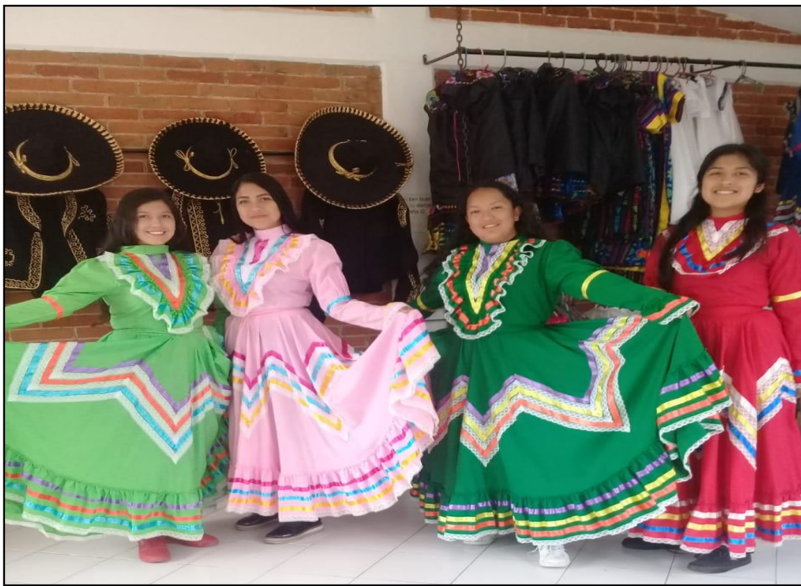
Ballet Municipal de Zacazonapan

"2019. Año del Centésimo Aniversario Luctuoso de Emiliano Zapata Salazar, El Caudillo del Sur"