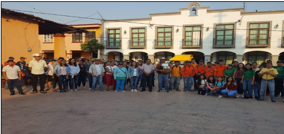
Acciones por el clima en el Municipio de Zacazonapan, "Trabajamos en equipo"

"2019. Año del Centésimo Aniversario Luctuoso de Emiliano Zapata Salazar, El Caudillo del Sur"