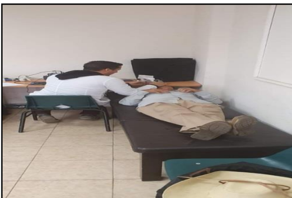
Impulso a la salud visual