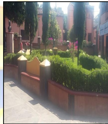
Parques y jardines

III.III.III. Área responsable: Panteones