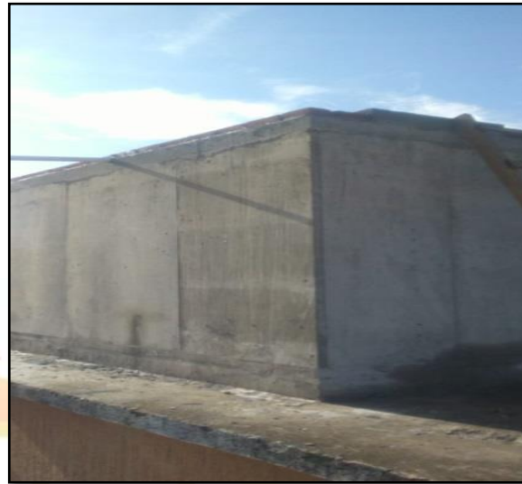
Tanques de almacenamiento de agua.