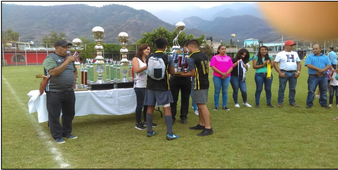
Premiación del Primer Torneo de Frontón Varonil

"2019. Año del Centésimo Aniversario Luctuoso de Emiliano Zapata Salazar, El Caudillo del Sur"