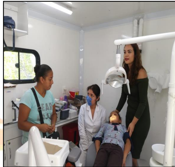
Atención médico- odontológico preventivo y curativo